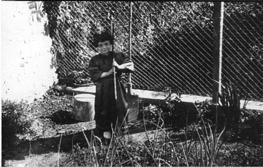
Moi, en tenue de procession avec ma couronne d'épines et la croix

A chaque reposoir , le prêtre montait quelques marches pour une courte cérémonie et passait entre deux rangées de fillettes appelées ( Angelot ) , habillées tout en blanc , une couronne de fleurs sur la tête ; Autour du cou , elles portaient de petites corbeilles pleines de pétales de rose qu'elles jetaient à la volée.